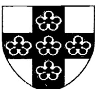
Ysgol Dewi Sant