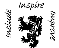
Sir Thomas Picton School